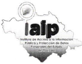
TABLA DE APLICABILIDAD DE LAS OBLIGACIONES DE TRANSPARENCIA COMUNES Y ESPECÍFICAS QUE DEBEN PUBLICAR EN EL PORTAL DE INTERNET Y EN LA PLATAFORMA NACIONAL DE TRANSPARENCIA.

SUJETO OBLIGADO: AYUNTAMIENTO DE TEOLOCHOLCO